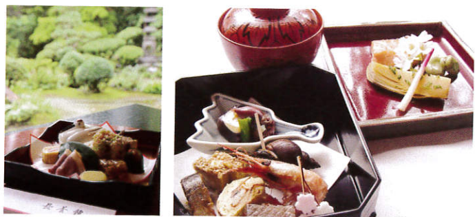
日本海の幸を中心に出来たての料理が一品づつ個室の部屋に運ばれる