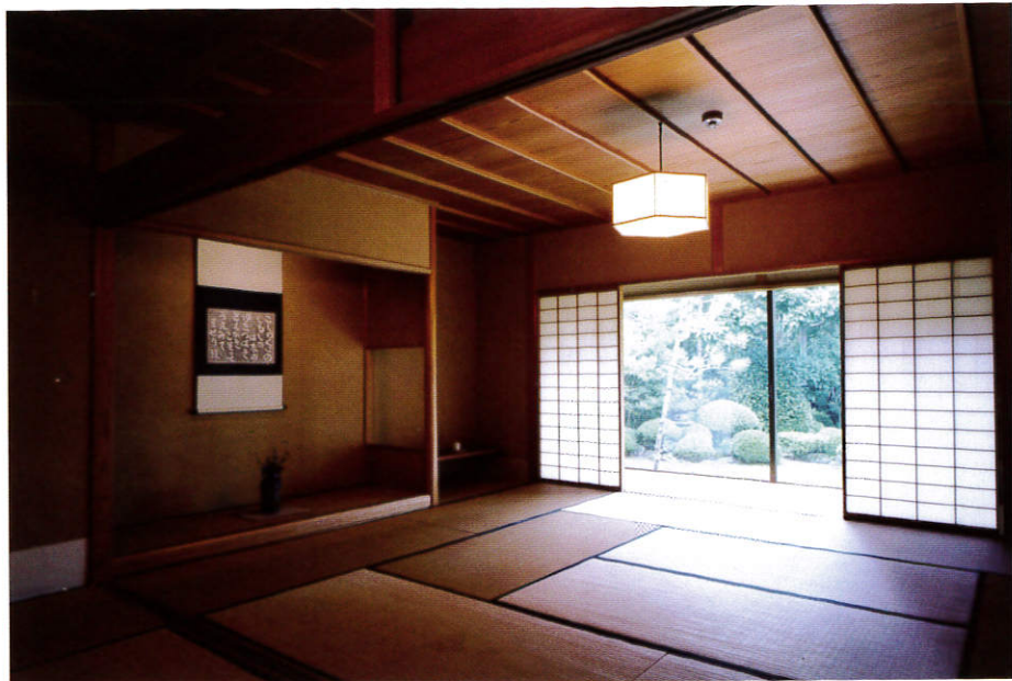
どの部屋からも庭園を眺めることができる。穏やかな光によって削り出される雰囲気、食事の時間をさらなる至福の時にする