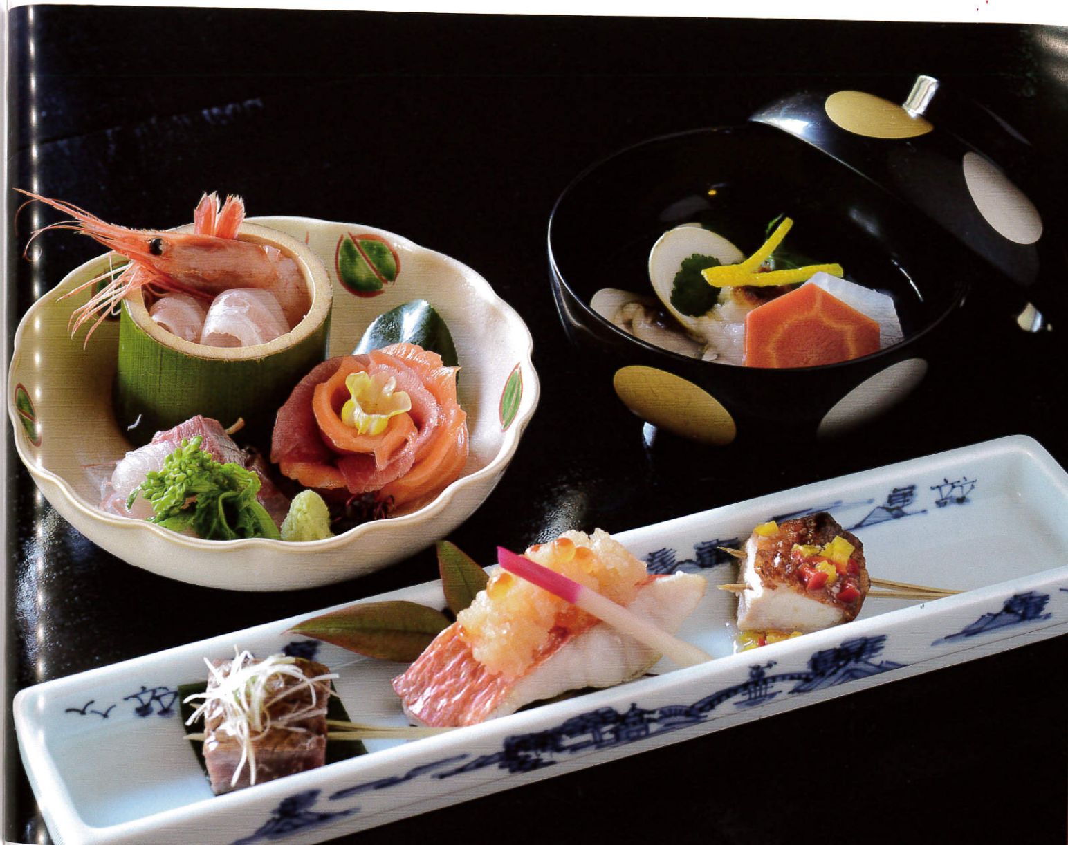
季節やお客様の性別や年齢層などによって変化する献立。何度訪れても新鮮な驚きを味わわせてくれるのが長養館