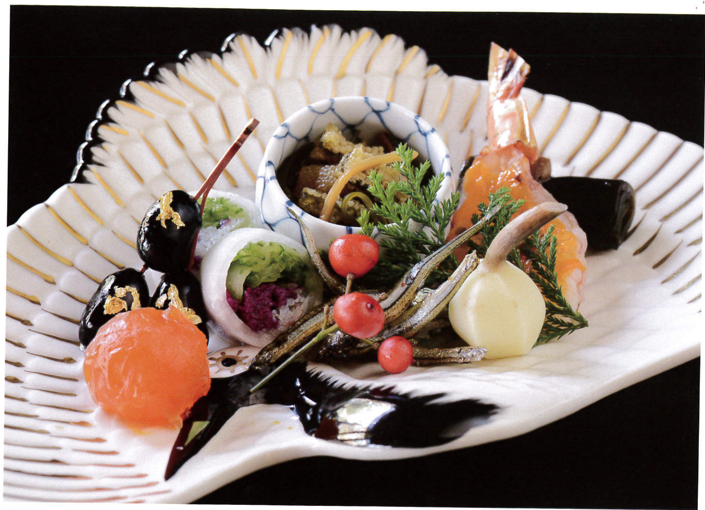
色鮮やかな料理が目にも眩しい。色彩を抑えた室内を計算にいれて施された多彩な色合いが職人の心配りを表すようだ

お問い合わせ ●025-523-5481 ●住所/上越市(越後高田)寺町2-1-8 ●営/11:30~22:00 ●休/不定休 ●http://www.niks.or.jp/chouyoukan/