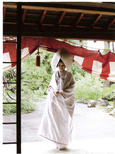
一日一組限定の婚礼も承っている。窓に広がる日本庭園からやさしい陽射しが注ぎ込む会場は、格調高さの中にもリラックスした雰囲気を感じ出す