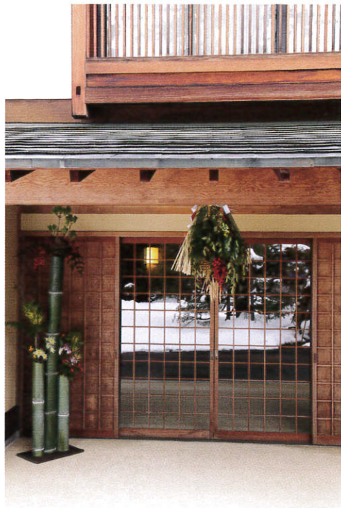
正面入り口。季節折々の飾りつけが楽しめる