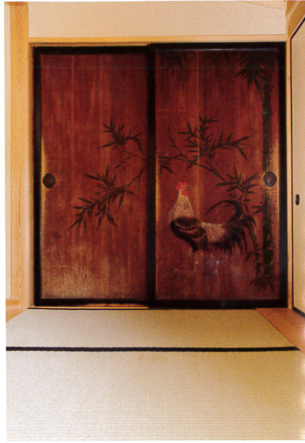
明治6年に取り壊された高田城にあった板戸も保存されている