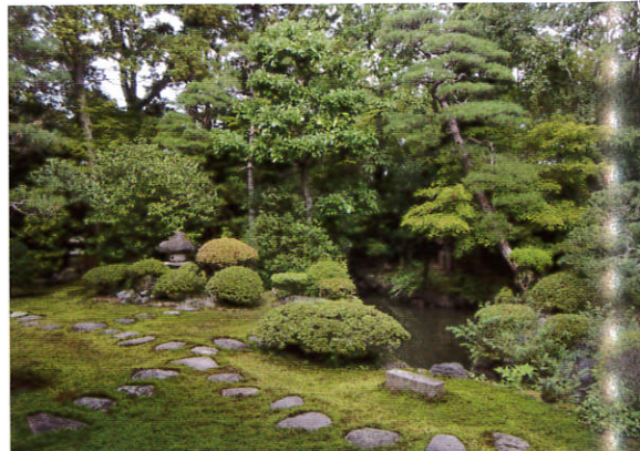
四季折々の顔を見せる700坪の庭園