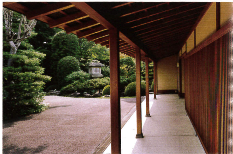
高田が発祥の地といわれる雁木（がんぎ）を再現している。長養館を訪れた人の人気撮影スポット